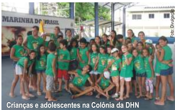
Crianças e adolescentes na Colônia da DHN

entre tantos outros indispensáveis para a formação do ser humano.