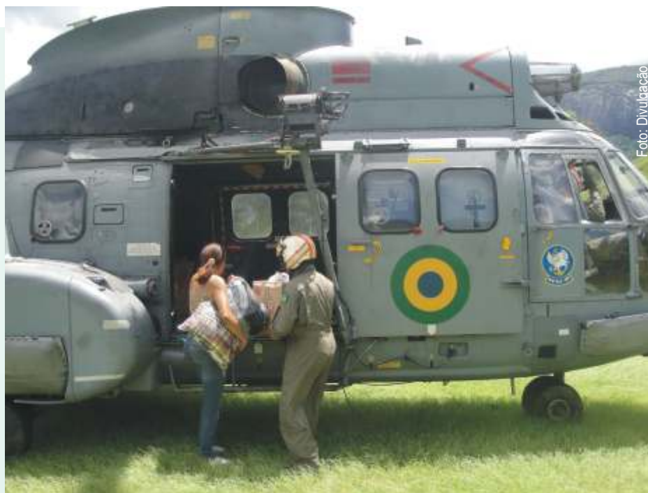
Moradores de Nova Friburgo recebem doativos

As chuvas acabaram com a cidade. Onde antes havia ruas, praças e casas, virou lama. Uma