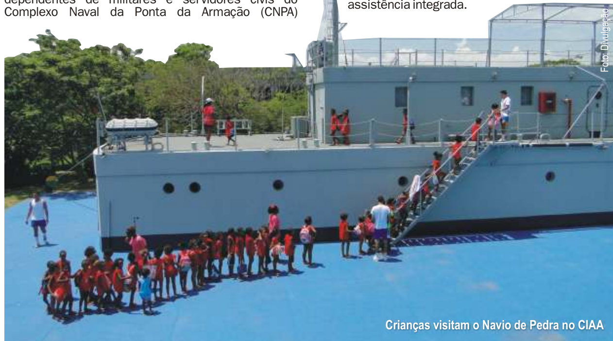
Crianças visitam o Navio de Pedra no CIAA

Música, brincadeiras, esporte, natação e visita às instalações do Navio de Pedra do CIAA foram realizados ao longo do dia pelas crianças na faixa etária de 3 a 13 anos. Além da proposta de diversão no período de férias dessas crianças, é importante ressaltar o papel social desta iniciativa, no sentido de promover a integração entre a instituição e a comunidade, bem como reforçar a cidadania e valores ético-morais que permeiam as ações da assistência integrada.