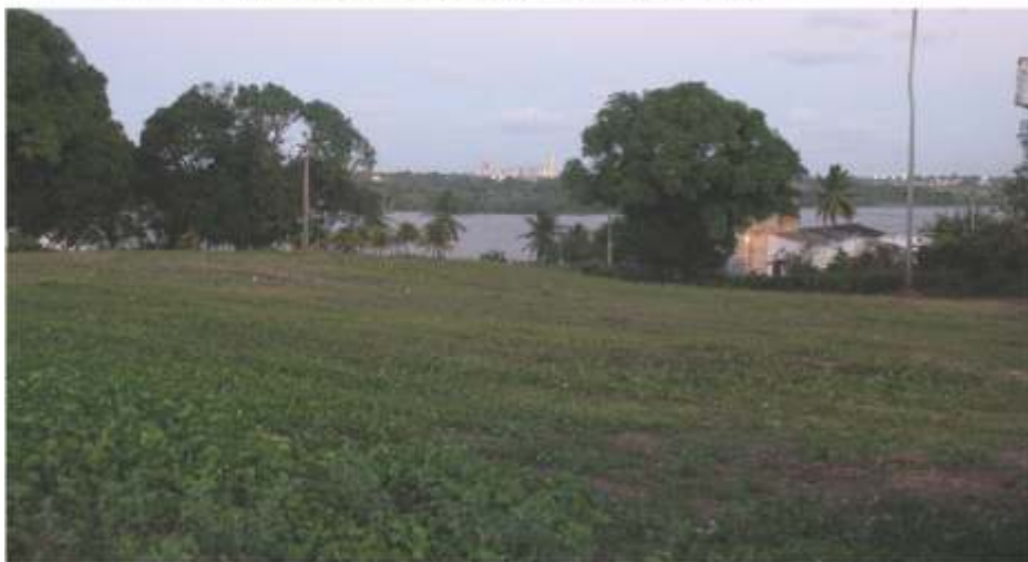
Terreno em Extremoz, mostrando a lagoa ao fundo.

Está em andamento a elaboração de projeto de arquitetura para construção, por meio Associativo com a Caixa Econômica Federal, pelo Projeto "Minha Casa Minha Vida", de 49 residências em terrenos da CCCPM dentro do Condomínio Estrela do Mar.